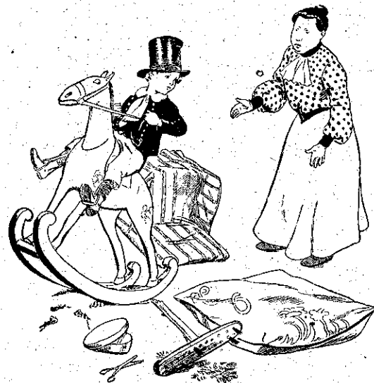
"Ελα λοιπόν να κοιμηθῆς!

Χάνει τὴν ύπομονή της η μαμμά του, και τον άφίνει να κόρη ό,τι θέλει. Και είνε δέκα ή ώρα, όταν ο φιλαράκος μας, κουρασμένος και νυσταγμένος, αποφασίζει να πέσῃ να κοιμηθῇ.