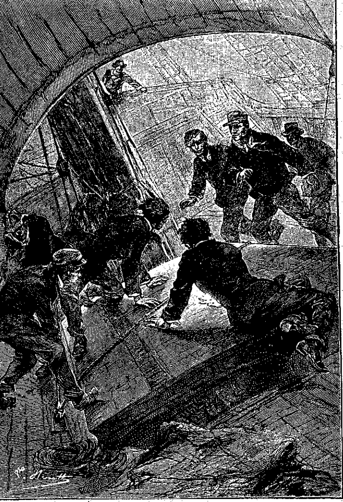
«Έπευσεν άμέσως ό Ουίλ Μιτζ.» (Σελ. 354, σελ. γ.)

κελ εις τον θλαχαικόν του και τούς ναύτας εις το υπόστρωμα της πρώρας. Κατόπιν ό Ουίλ Μιτζ, βοηθούμενος από τούς νέους, θα εκυβερνούσε το πλοίο εις τρόπον ώστε να επιστρέψη εις τας Άντιλλας, ή τουλάχιστον να πλησιάση το πρώτον πλοίο, το όποιον θα διασχύσων την πορείαν του. Η λέμβος ώλισθησεν άθροβρώς δίπλα εις το σκάφος και έσταμάτησε κοντά στα περσέχρητα του μεγάλου ιστού, άριστερά. Άμα επιάνοντι έκεί από τα σιδηροδέματα και τα καρπούζια των έξερτίων, εύκολον ήτο να πηδήσουν όλοι επάνω από την κουραστήν εις το κατάστρωμα του πλοίου. Πρώτος ανέβη ό Ουίλ Μιτζ. Μόλις όμως έφερε την κεφαλήν του εις το ύψος του αιώροθεσίου, δέκοψε την αναρρίχασίν του και έννευσεν εις τούς άλλους να μη σαλεύσουγ. Ό Χάρρης Μάρκελ ειχεν έξέλθη από τον θλαχαικόν του και εκύτιχζε τον καιρόν. Έπειδή δε τα πανιά έξηκολούθουν να παραδέρνον εις τούς ιστούς, έφώναξε το πλήρωμα δια να κερουλήσουσιν καταλήλους να τας κερχιάς. Οι νάυται έκοιμώντο, και κανείς δεν άπήνητησε. Ό Χάρρης Μάρκελ διηυθύνθη τότε προς το υπόπρυγμα της πρώρας. Ό Ουίλ Μιτζ παρηκολούθει τας κινήσεις του, και τον είδεν εξαφανιζόμενον εις την κάδοδον. Ητο πλέον ή στιγμή